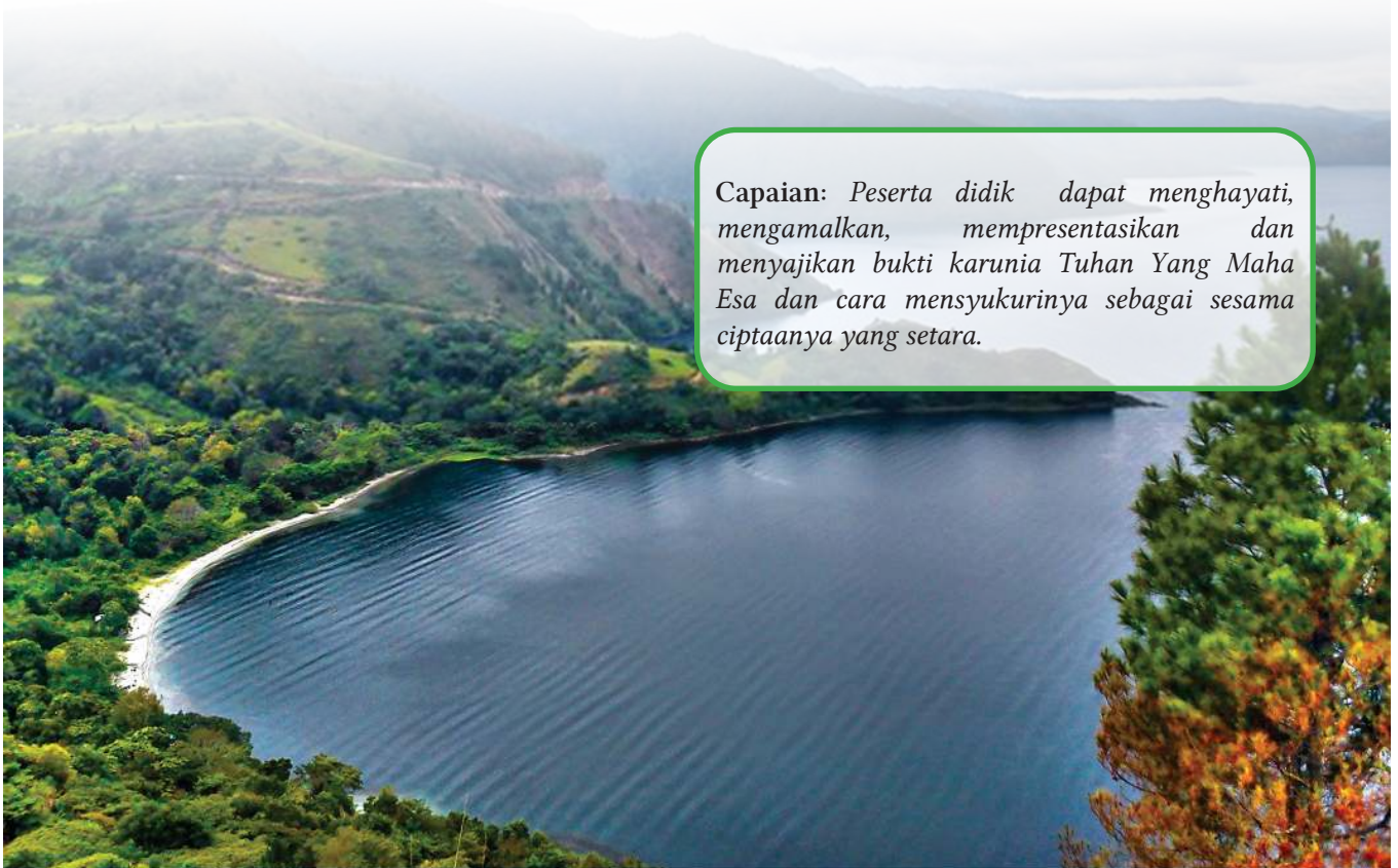
Gambar 4.1. Bentang Alam Ciptaan Tuhan Yang Maha Esa

Capaian: Peserta didik dapat menghayati, mengamalkan, mempresentasikan dan menyajikan bukti karunia Tuhan Yang Maha Esa dan cara mensyukurinya sebagai sesama ciptaanya yang setara.