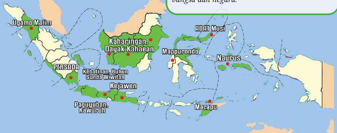
Gambar 1.1. Peta sebaran penghayat

Capaian: Peserta didik dapat menghayati menganalisis dan mengkomunikasikan aspek sejarah, asal usul kehidupan dan keberagaman kepercayaan dengan argumentasi logis, santun dan kreatif dalam lingkungan masyarakat, bangsa dan negara.