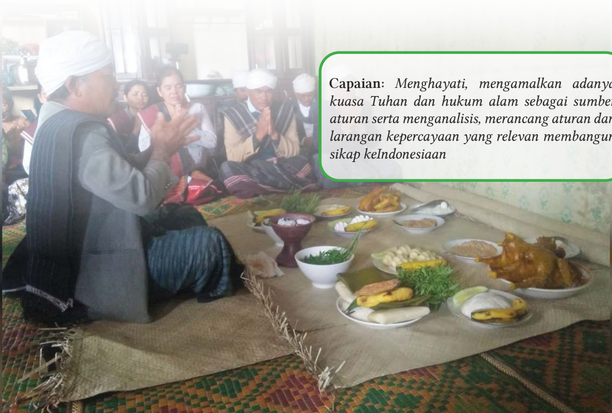
Gambar 7.1. Ketentuan Ritual (Persembahan Ritual Pasahat Tondi, Parmalim)

Capaian: Menghayati, mengamalkan adanya kuasa Tuhan dan hukum alam sebagai sumber aturan serta menganalisis, merancang aturan dan larangan kepercayaan yang relevan membangun sikap keIndonesiaan