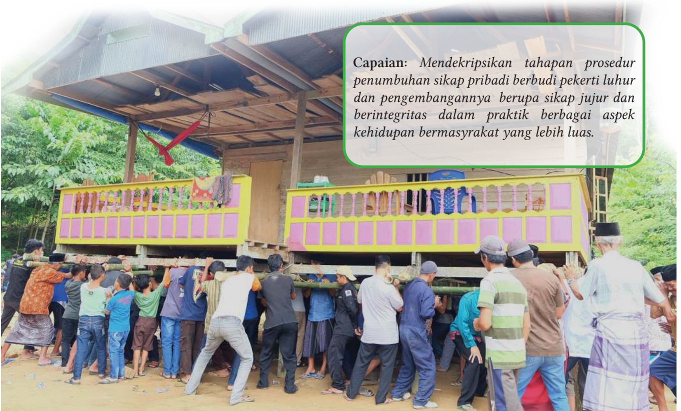
Gambar 3.1. Marakka' Bola : Tradisi Gotong Royong Memindahkan Rumah

Capaian: Mendeskripsikan tahapan prosedur penumbuhan sikap pribadi berbudi pekerti luhur dan pengembangannya berupa sikap jujur dan berintegritas dalam praktik berbagai aspek kehidupan bermasyarakat yang lebih luas.