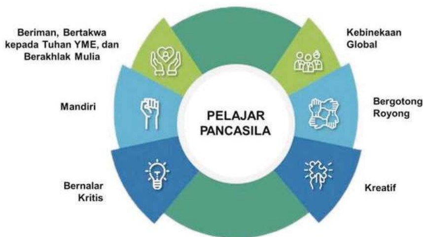
Gambar 1.1 Profil Pelajar Pancasila Sumber: Renstra Kemendikbud 2020-2024

Profil Pelajar Pancasila menjadi salah satu ciri keberhasilan yang nantinya mampu menyiapkan menjadi generasi muda dalam menghadapi tantangan dan Revolusi Industri 4.0. Sumber daya manusia yang unggul merupakan pelajar sepanjang hayat yang memiliki kompetensi secara global dan mampu berperilaku sesuai dengan nilai-nilai Pancasila.