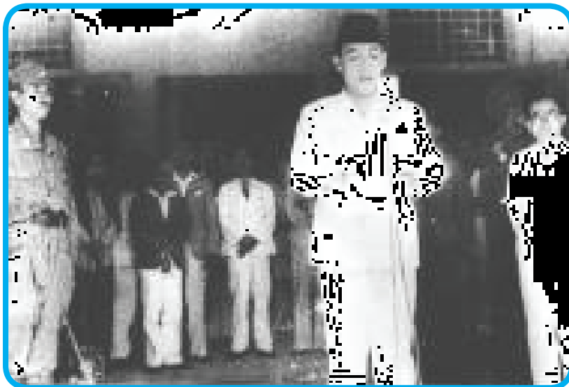
Gambar 6.1 Pembacaan Teks Proklamasi oleh Ir. Soekarno

Coba kalian amati gambar 6.1 di bawah ini.