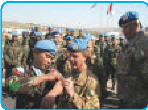
Gambar 4.4 TNI menjadi bagian dari misi perdamaian dunia