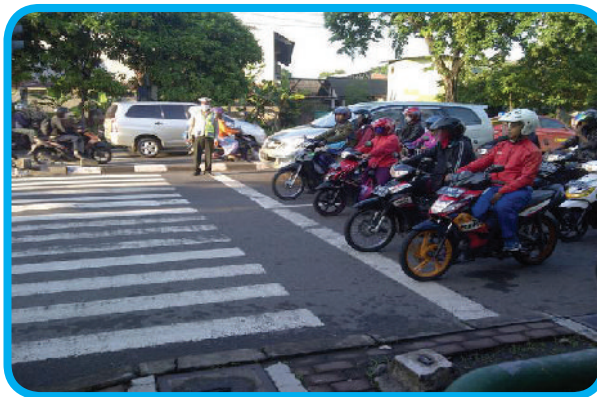
Gambar 3.2. Para pengguna jalan wajib mematuhi peraturan lalu lintas

Demikianlah hukum itu pada hakikatnya merupakan pagar pembatas, agar kehidupan manusia aman dan damai. Coba bayangkan jika seandainya di negara kita ini tidak ada hukum. Dapat diperkirakan, kesemrawutan akan terjadi dalam segala hal, mulai dari kehidupan pribadi sampai pada kehidupan berbangsa dan bernegara. Sebagai contoh, kalau seandainya tidak ada peraturan lalu lintas, kita tidak akan dapat memperkirakan ke arah mana seorang pengendara kendaraan bermotor akan berjalan, di sebelah kiri atau kanan. Pada saat lampu menyala merah apakah pengendara akan berhenti atau jalan? Dengan adanya peraturan lalu lintas, maka para pengendara kendaraan bermotor harus berjalan di sebelah kiri. Jika lampu pengatur lalu lintas berwarna merah, maka semua kendaraan harus berhenti. Arus lalu lintas menjadi tertib dan keselamatan orang pun dapat terjamin.