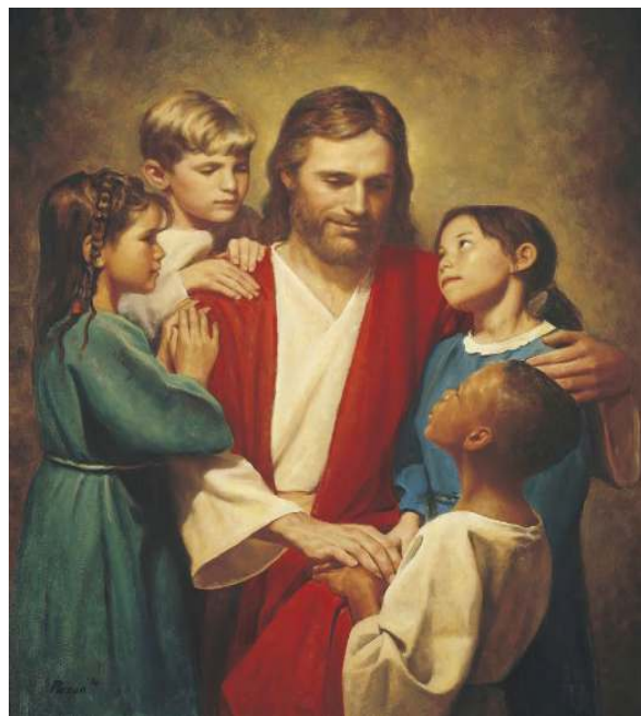
Gambar 1.1. Yesus bersama anak-anak.