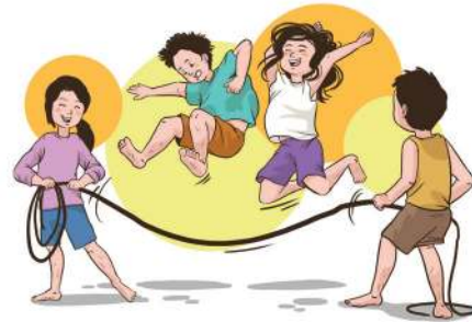
Ilustrasi: Febrianus H. Alamsyah