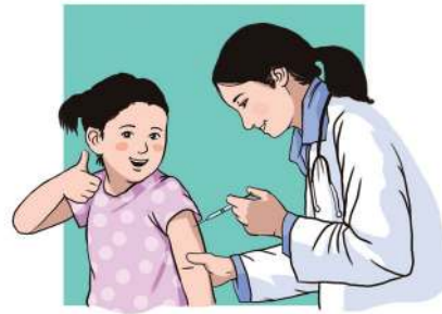
Ilustrasi: Febrianus H. Alamsyah