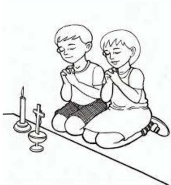
Gambar 4.2 Berdoa