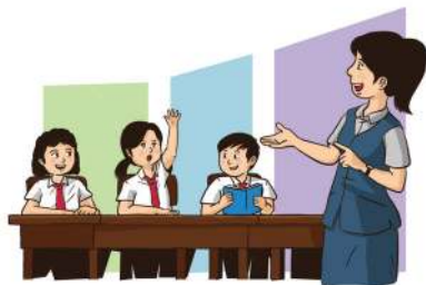
Ilustrasi: Febrianus H. Alamsyah