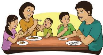
Ilustrasi: Febrianus H. Alamsyah