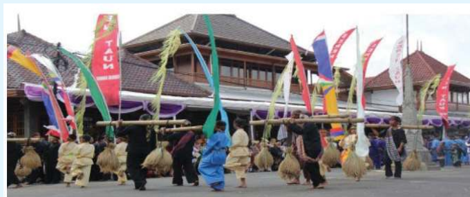
Gambar 4.1 acara seren Taun Cigugur

Setelah rajah pamunah selesai, ketua adat AKUR memberikan sejumlah halu (alu) kepada perwakilan tamu undangan yang kemudian bergerak menuju kepanutuan yang berlokasi di halaman utara Paseban untuk melaksanakan prosesi menumbuk padi sebagai puncak acara adat Seren Taun. Pelaksanaan prosesi menumbuk padi ini juga melibatkan seluruh tamu yang menghadiri upacara Seren Taun.