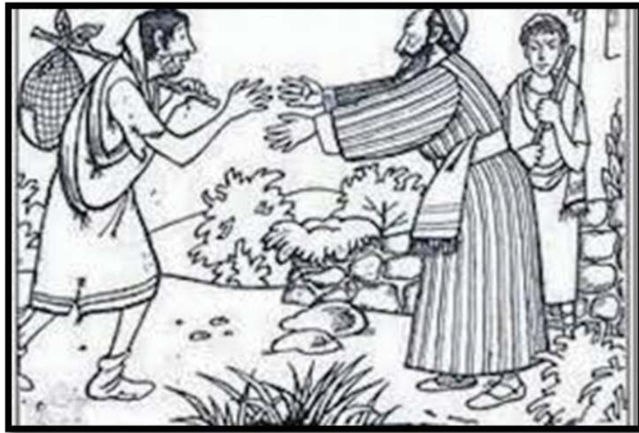
Gambar 3.1 Perumpamaan Anak yang Hilang

Warnailah gambar perumpamaan tentang Anak yang Hilang berikut ini, serta tulishlah doa tobat yang berisi pengakuan atas dosa dan kesalahan yang pernah kalian dilakukan, serta permohonan agar Tuhan mengampuni dosa dan kesalahanmu!