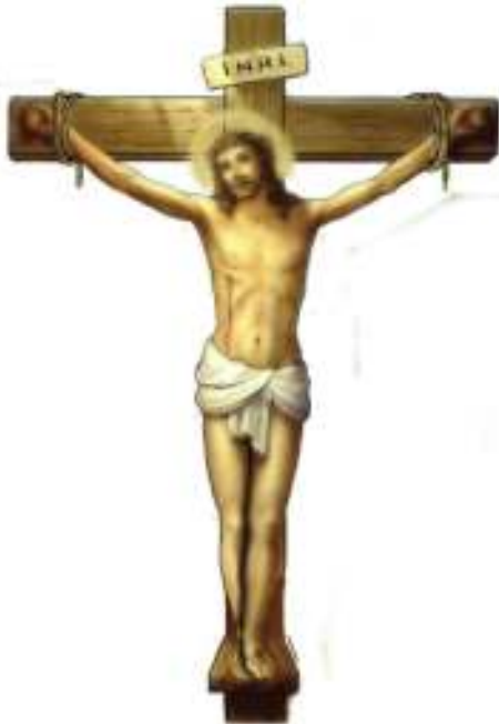
Gambar Yesus Disalibkan

Simaklah cerita di bawah ini mengenai kisah "Yesus Disalibkan"!