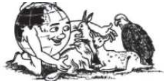
12. Menjaga kelestarian binatang yang sudah hampir punah