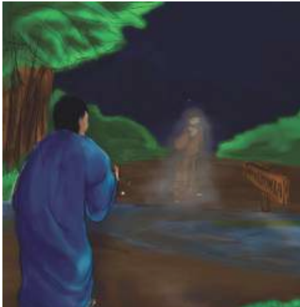
Gambar Roh Kudus mengarahkan Paulus ke Makedonia

Paulus dan Silas adalah pelayan-pelayan Tuhan yang memberitakan Kabar Baik tentang Yesus Kristus kepada banyak orang. Karena tugas itu, mereka pergi dari satu tempat ke tempat yang lain; mereka mengunjungi desa dan juga kota untuk memberitakan Injil. Pelayanan dan pengajaran mereka itu membuat iman jemaat bertumbuh kuat. Itulah tugas yang mereka lakukan: memberitakan Injil, melayani, dan mengajar jemaat Kristen.