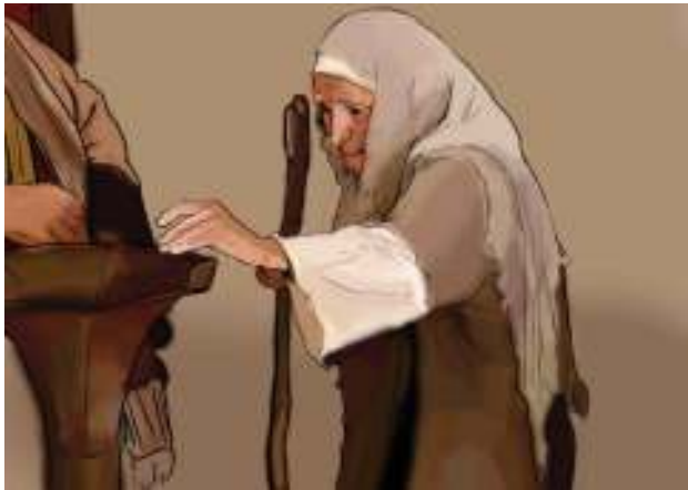
Gambar Perempuan Tua yang memberikan persembahan (Lihat Lukas 21:1-4)

Dalam kisah di Lukas 2:1-4 kamu dapat melihat bagaimana seorang perempuan miskin memberikan persembahan dengan rela hati. Menurut Yesus persembahan perempuan itu justru bernilai tinggi, meskipun jumlahnya sedikit. Nilai artinya kualitas, sementara jumlah artinya kuantitas. Allah tidak melihat jumlah, tetapi kualitas si pemberi.