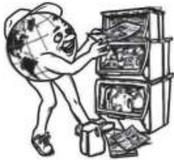
7. Menempatkan barang pada tempatnya