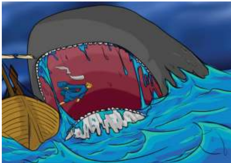
Gambar ikan besar menelan Yunus

Orang-orang itu bertanya, "Apa yang dapat kami lakukan untuk menghentikan badai itu?" Jawab Yunus, "Lemparkanlah aku dari kapal ini ke dalam laut yang dilanda badai itu. Lalu badai akan surut." Semula orang-orang itu tidak mau melakukannya. Namun akhirnya mereka melemparkan Yunus ke dalam laut yang dilanda badai itu, dan badai pun surut.