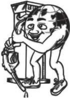
8. Berhemat dalam menggunakan bahan bakar kendaraan