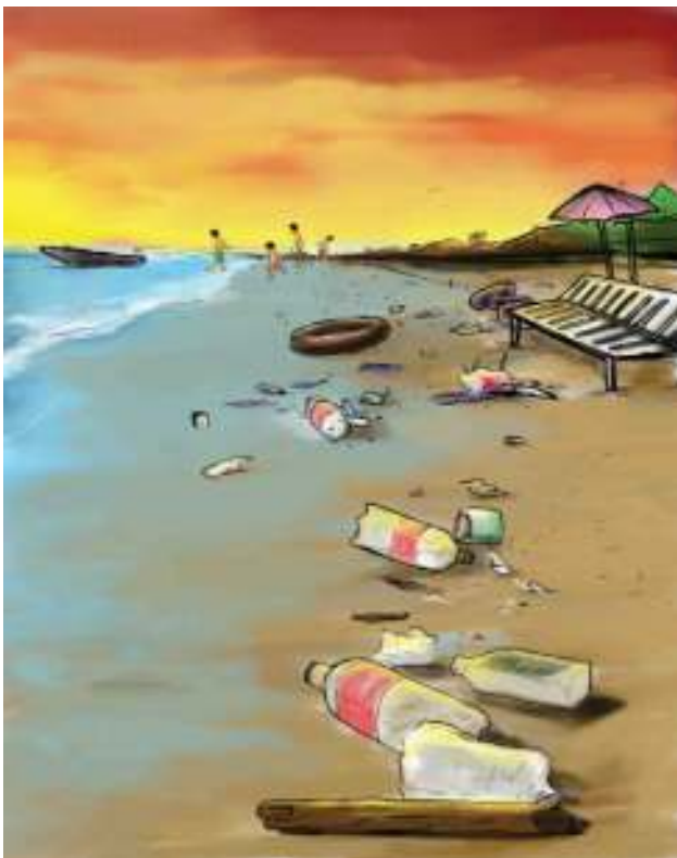
Gambar Tepi Pantai/Danau yang Kotor

ini, saya akan selalu memperhatikan alam yang indah sehingga tidak lagi dirusak oleh siapapun juga. Mulai dari sekarang saya akan selalu mencintai alam."