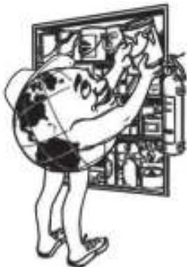
10. Simpan benda yang mengandung zat kimia baik-baik

Dua belas hal di atas hanya sebagian contoh kecil yang menggambarkan bagaimana kita mencintai alam ciptaan Tuhan. Tahukah kamu, ketika Tuhan menciptakan alam semesta, yang dimaksud alam semesta adalah segala sesuatu yang ada di bumi ini? Baik yang di darat, air maupun yang di udara. Dengan demikian, mencintai lingkungan hidup berarti kita juga mencintai alam semesta ini. Mencintai lingkungan hidup dapat dilakukan dengan selalu menjaga alam semesta ciptaan Tuhan.