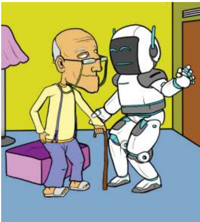
Gambar Robot yang Sedang Menolong Orang yang sudah tua

Beberapa waktu yang lalu, orang-orang yang cerdas di Jepang mengembangkan sebuah robot yang dapat membantu orang yang sudah tua dan pelupa. Robot itu akan menolong mereka untuk mengingatkan makan atau minum obat.