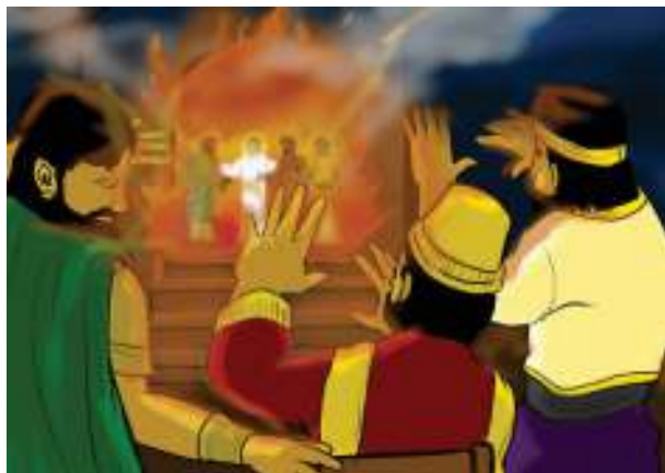
Gambar Malaikat, Sadrakh, Mesakh, dan Abednego

Suatu hari Raja Nebukadnezar membuat sebuah patung dari emas yang tinggi. Lalu ia mengirim utusan ke seluruh penjuru negerinya. Ia memerintahkan semua rakyatnya datang ke tempat patung itu.