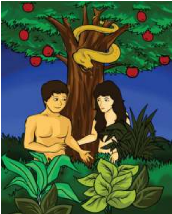
Gambar Adam dan Hawa yang digoda ular

Simaklah cerita berikut ini dengan saksama!