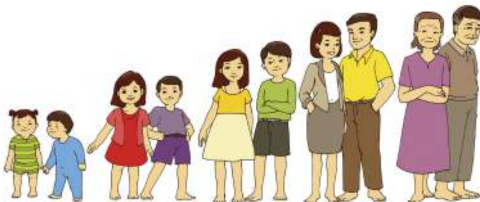
Gambar 1.13