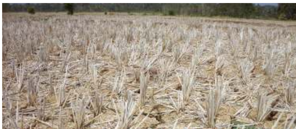
Gambar 1.5