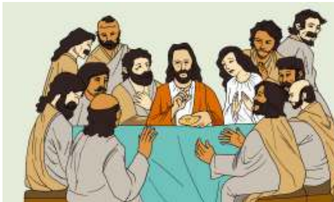
Gambar 4.3

Dan ketika mereka sedang makan, Yesus mengambil roti, mengucap berkat, memecah-mecahkannya lalu memberikannya kepada murid-murid-Nya dan berkata: "Ambillah, makanlah, inilah tubuh-Ku." Sesudah itu Ia mengambil cawan, mengucap syukur lalu memberikannya kepada mereka dan berkata: "Minumlah, kamu semua, dari cawan ini.