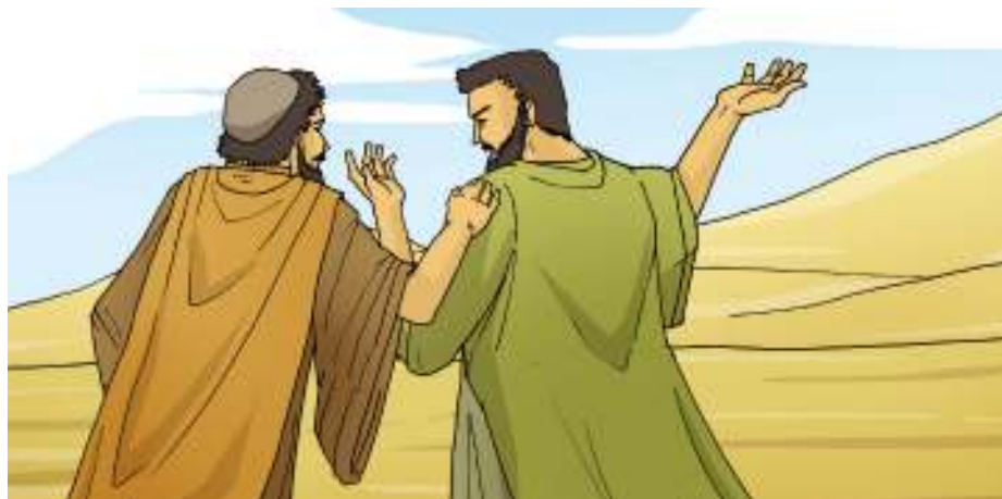
Gambar 1.13

Hanya, kuatkan dan teguhkanlah hatimu dengan sungguh-sungguh, bertindaklah hati-hati sesuai dengan seluruh hukum yang telah diperintahkan kepadamu oleh hamba-Ku Musa; janganlah menyimpang ke kanan atau ke kiri, supaya engkau beruntung, ke mana pun engkau pergi. Janganlah engkau lupa memperkatakan kitab Taurat ini, tetapi renungkanlah itu siang dan malam, supaya engkau bertindak hati-hati sesuai dengan segala yang tertulis di dalamnya, sebab dengan demikian perjalananmu akan berhasil dan engkau akan beruntung.