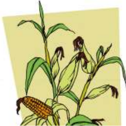
Gambar 3.3

Ada seorang petani tua yang berasal dari sebuah desa dan sangat kaya raya. Tanahnya berhektar-hektar, jagungnya selalu tumbuh subur dan buahnya sangat banyak. Panennya tak pernah gagal dan ia adalah sosok yang sangat dermawan. Ia selalu membagikan bibit jagung berkualitas baik kepada tetangga-tetangganya