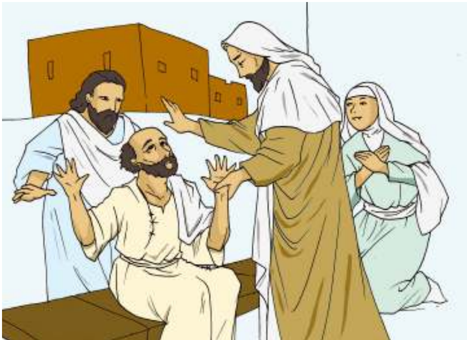
Gambar 2.19

Kemudian Yesus pergi ke Kapernaum, sebuah kota di Galilea, lalu mengajar di situ pada hari-hari Sabat. Mereka takjub mendengar pengajaran-Nya, sebab perkataan-Nya penuh kuasa.