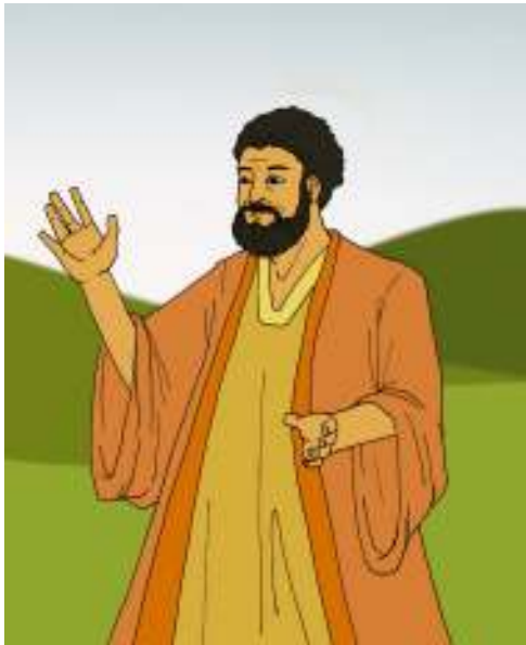
Musa bersyukur Gambar 4.1

hujan ke atas tumbuh-tumbuhan. Sebab nama TUHAN akan kuserukan: Berilah hormat kepada Allah kita, Gunung Batu, yang pekerjaan-Nya sempurna, karena segala jalan-Nya adil, Allah yang setia, dengan tiada kecurangan, adil dan benar Dia. Berlaku busuk terhadap Dia, mereka yang bukan lagi anak-anak-Nya, yang merupakan noda, suatu angkatan yang bengkok dan belat-belit.