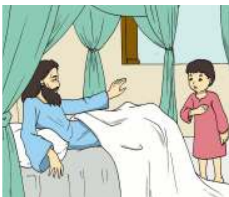
Gambar 2.5

Pada suatu malam, Samuel tidur di halaman Kemah Kudus. Ia dipanggil oleh Tuhan, kata-Nya: "Samuel, hai Samuel!" Dengan segera Samuel pergi kepada Eli dan berkata: "Saya, tuan!" Eli menyahut: "Aku tidak memanggil Engkau. Pergi dan tidur terus!" Samuel pergi dan berbaring lagi. Sekali lagi Tuhan memanggilnya, kata-Nya: "Samuel, hai Samuel!" Maka Samuel bangun dan pergi kepada Eli, katanya: "Saya, tuan!" Eli menjawab: "Aku tidak memanggil, kembalilah dan berbaring saja!" Belum diketahui Samuel bahwa ia dipanggil Allah. Untuk ketiga kalinya Tuhan memanggilnya: "Samuel, hai Samuel!" Ia bangun dan pergi kepada Eli, katanya: "Saya, tuan!" Eli mengerti bahwa anak itu dipanggil oleh Tuhan, maka ia berkata kepadanya, "Berbaringlah kembali, hai anakku, dan jika engkau dipanggil lagi, katakanlah: Berfirmanlah, ya Tuhan, maka hamba-Mu akan mendengarkan!" Lalu Tuhan bersabda kepadanya: "Aku akan menepati apa yang Kufirmankan kepada Eli. Sebab ia mengerti betapa jahatnya anak-anaknya, namun ia tidak menghukum mereka!" Samuel tidur terus.