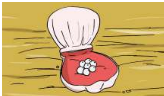
Gambar 2.15

Yesus membentangkan suatu perumpamaan lain lagi kepada mereka, kata-Nya: “Hal Kerajaan Sorga itu seumpama orang yang menaburkan benih yang baik di ladangnya. Tetapi pada waktu semua orang tidur, datanglah musuhnya menaburkan benih ilalang di antara gandum itu, lalu pergi. Ketika gandum itu tumbuh dan mulai berbulir, nampak jugalah ilalang itu. Maka datanglah hamba-