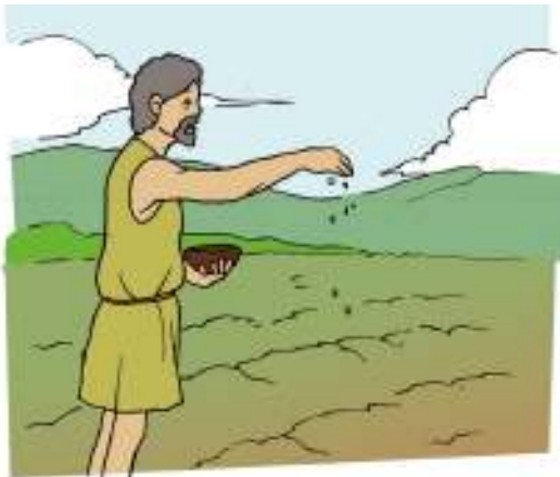
Gambar 2.13

Pada hari itu keluarlah Yesus dari rumah itu dan duduk di tepi danau. Maka datanglah orang banyak berbondong-bondong lalu mengerumuni Dia, sehingga Dia naik ke perahu dan duduk di situ, sedangkan orang banyak semuanya berdiri di pantai. Dan Dia mengucapkan banyak hal dalam perumpamaan kepada mereka. Kata-Nya: "Adalah seorang penabur keluar untuk menabur.