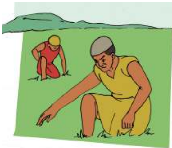
Gambar 2.14

yang ada padanya akan diambil dari padanya. Itulah sebabnya Aku berkata-kata dalam perumpamaan kepada mereka; karena sekalipun melihat, mereka tidak melihat dan sekalipun mendengar, mereka tidak mendengar dan tidak mengerti”.