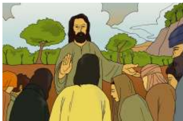
Banyak orang tertegun mendengar pengajaran Yesus