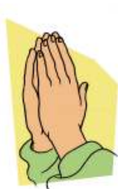
Gambar 4.4