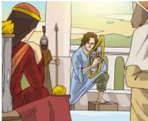
Gambar 27

batinnya." Enam anak Isai lain dihadapkan kepada Samuel. Tetapi Samuel berkata kepada Isai, "Tidak ada yang dipilih Allah. Apakah ini sekalian putramu?" Sahut Isai, "Tinggal yang bungsu, Daud namanya. Sekarang ini dia menggembalakan domba." Samuel berkata: "Suruhlah memanggil dia!" Ketika Daud menghadap Samuel, Tuhan bersabda kepada Samuel: "Inilah dia!" Samuel mengambil tanduk berisi minyak, lalu Daud diurapinya di hadapan kakak-kakaknya.