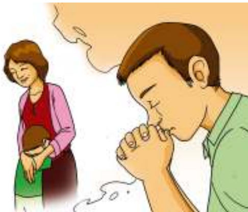
Gambar 4.5

tapi itu tidak mungkin. Belum tentu ibunya mendengarnya. Apa yang harus dia lakukan? Dia membayangkan dirinya tidak bisa pulang karena dia tidak membawa uang untuk ongkos naik bus dan ia tidak mempunyai handphone untuk menghubungi ibunya.