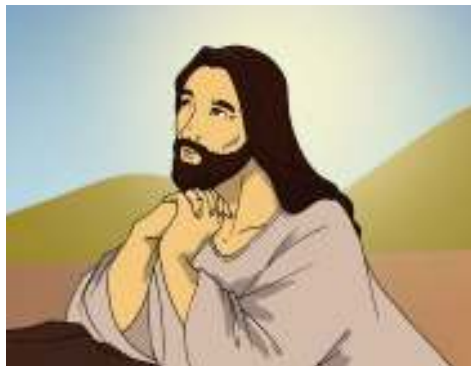
Gambar 4.6

Tetapi jika engkau memberi sedekah, janganlah diketahui tangan kirimu apa yang diperbuat tangan kananmu. Hendaklah sedekahmu itu diberikan dengan tersembunyi, maka Bapamu yang melihat yang tersembunyi akan membalasnya kepadamu.”