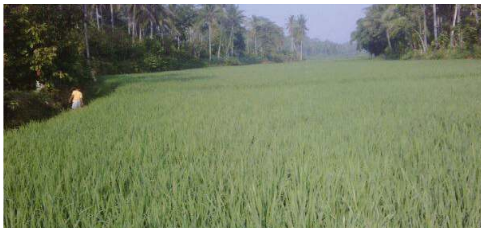
Gambar 1.4

Perhatikan gambar-gambar berikut ini dan jawab pertanyaan di bawahnya!