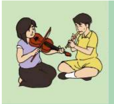
Gambar 1.10