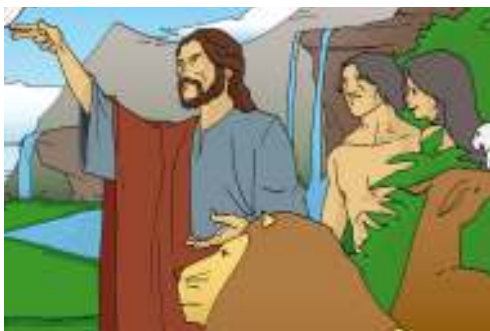
Gambar 1.8

Simaklah teks Kitab Suci (Kejadian 1:27-28) berikut ini!