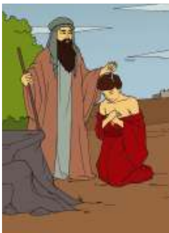
Gambar 2.6

Ketika Samuel sampai pada masa tuanya, anak-anaknya diangkatnya menjadi hakim di Israel. Tetapi mereka tidak menempuh jalan ayahnya. Mereka korupsi dan berlaku tidak adil. Oleh sebab itu, orang tua-tua berkata kepada Samuel: "Berikanlah kepada kami seorang raja seperti bangsa-bangsa lain!" Permintaan itu tidak berkenan kepada Samuel. Ia berdoa kepada Tuhan. Tuhan bersabda kepadanya: "Buatlah menurut keinginan rakyat. Karena mereka tidak membuang engkau melainkan Aku, sehingga Aku tidak lagi diakui sebagai raja oleh mereka! Tetapi serahkanlah semua hak raja kepada mereka!" Samuel mengumpulkan rakyat, tetapi mereka tidak mendengarkannya, dan berteriak: "Berilah kami seorang raja!" Pada waktu itu, hiduplah di tanah Benyamin seorang yang bernama Saul. Di seluruh Israel tiada seorang pun yang seelok rupanya.