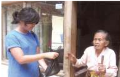
Gambar 3.2

Tanpa mengingat atau mengharapkan imbalan, kita sepatutnya selalu bersedia untuk membantu dan menolong mereka, terutama ketika mereka berada di dalam keadaan yang memerlukan bantuan. Misalnya ketika mereka sedang lelah, sakit, tidak berdaya atau merasa kesepian.