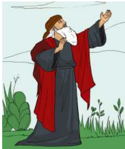
Gambar 2.11

“Sesungguhnya, hamba-Ku akan berhasil, ia akan ditinggikan, disanjung dan dimuliakan. Seperti banyak orang akan tertegun melihat dia begitu buruk rupanya, bukan seperti manusia lagi, dan tampaknya bukan seperti anak manusia lagi. Demikianlah ia akan membuat tercengang banyak bangsa, raja-raja akan mengatupkan mulutnya melihat dia; sebab apa yang tidak diceritakan kepada mereka akan mereka lihat, dan apa yang tidak mereka dengar akan mereka pahami.”“Siapakah yang percaya kepada berita yang kami dengar, dan kepada siapakah tangan kekuasaan Tuhan dinyatakan?”