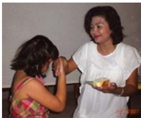
Sumber: Dok. Kemdikbud Gambar 3.1

Hormat kepada orang tua tidak sama dengan takut kepada mereka. Sebagai anak yang membutuhkan bim-bingan, kita harus terbuka dan berani mengatakan apa yang perlu kita sampaikan. Tetapi sebagai bentuk hormat, kita harus