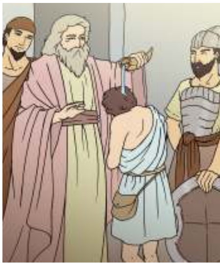
Sumber: Dok. Kemdikbud Gambar 2.12

Tetapi pada malam itu juga datanglah firman Tuhan kepada Natan, demikian: “Pergilah, katakanlah kepada hamba-Ku Daud: Beginilah firman Tuhan: Masakan engkau yang mendirikan rumah bagi-Ku untuk Kudiami? Aku tidak pernah diam dalam rumah sejak Aku menuntun orang Israel dari Mesir sampai hari ini, tetapi Aku selalu mengembara dalam kemah sebagai kediaman. Selama Aku mengembara bersama-sama seluruh orang Israel, pernahkah Aku mengucapkan firman kepada salah seorang hakim orang Israel, yang Kuperintahkan menggembalakan umat-Ku Israel, demikian: Mengapa kamu tidak mendirikan bagi-Ku rumah dari kayu aras? Oleh sebab itu, beginilah kaukatakan kepada hamba-Ku Daud: Beginilah firman Tuhan semesta alam: Akulah yang mengambil engkau dari padang, ketika menggiring kambing domba, untuk menjadi raja atas umat-Ku Israel.