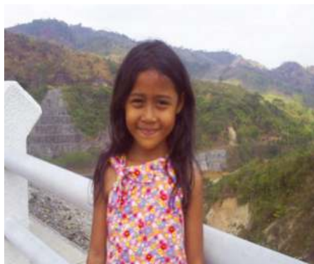
Gambar 1.1