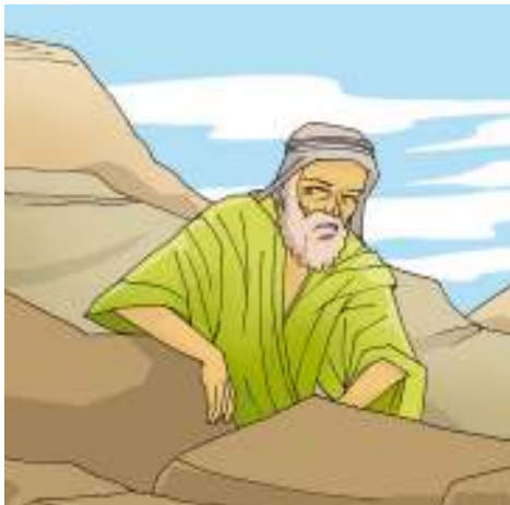
Gambar 2.2

Menyimak cerita Kitab Suci Ul 32:46-47; 33:26-29; 34:1-12