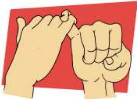
Gambar 2.10

dengan seseorang. Jika kita menepati janji, maka biasanya akan berbuah kebaikan, kegembiraan atau hal lain yang menyenangkan. Misalnya orang tua menjanjikan akan memberi hadiah, jika kita naik