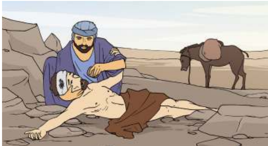
Sumber: Dok. Kemdikbud Gambar 3.4

Pada suatu kali berdirilah seorang ahli Taurat untuk mencobai Yesus, katanya: "Guru, apa yang harus kuperbuat untuk memperoleh hidup yang kekal?" Jawab Yesus kepadanya: "Apa yang tertulis dalam hukum Taurat? Apa yang kaubaca di sana?" Jawab orang itu: "Kasihilah Tuhan, Allahmu, dengan segenap hatimu dan dengan segenap jiwamu dan dengan segenap kekuatanmu dan dengan segenap akal budimu, dan kasihilah sesamamu manusia seperti dirimu sendiri." Kata Yesus kepadanya: "Jawabmu itu benar; perbuatlah demikian, maka engkau akan hidup."