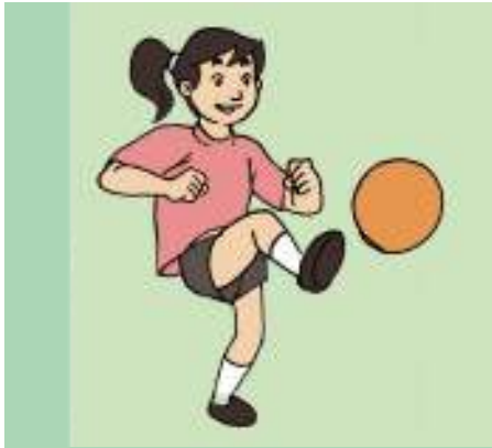
Gambar 1.9