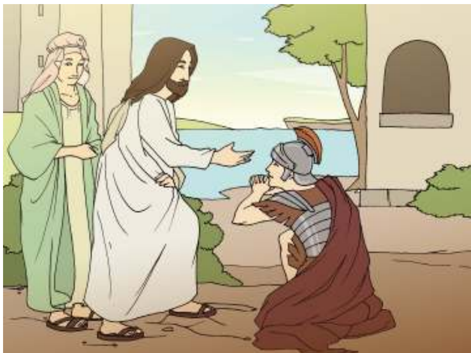
Gambar 2.18