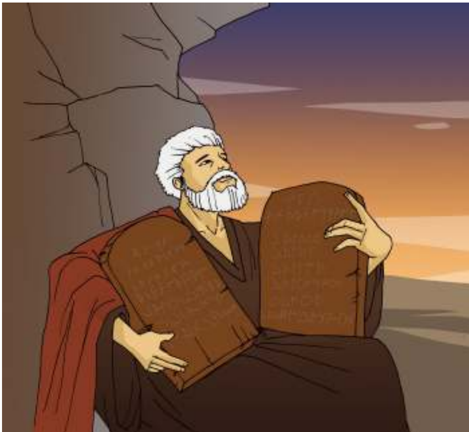
Gambar 2.1

“Sudah lebih dari dua bulan bangsa Israel berjalan melalui padang gurun yang gersang. Allah membimbing mereka dalam tiang awan, sehingga mereka menemukan mata air dan dan minum. Allah menurunkan manna dari langit dan sewaktu-waktu mereka dapat menangkap burung-burung puyuh yang kecapekan. Makanan mereka memang membosankan. Oleh karena itu, mereka mengeluh, “Dulu di Mesir kami duduk menghadapi kualiti berisi daging dan makan roti sampai kenyang.”