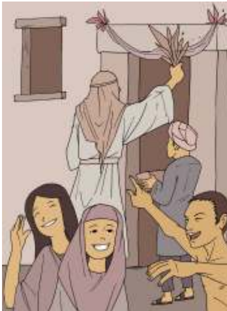
Gambar 4.2

Berfirmanlah TUHAN kepada Musa dan Harun di tanah Mesir: "Bulan inilah akan menjadi permulaan segala bulan bagimu; itu akan menjadi bulan pertama bagimu tiap-tiap tahun. Katakanlah kepada segenap jemaah Israel: Pada tanggal sepuluh bulan ini diambillah oleh masing-masing seekor anak domba, menurut kaum keluarga, seekor anak domba untuk tiap-tiap rumah tangga. Tetapi jika rumah tangga itu terlalu kecil jumlahnya untuk mengambil seekor anak domba, maka ia bersama-sama dengan tetangganya yang terdekat ke rumahnya haruslah mengambil seekor, menurut jumlah jiwa; tentang anak domba itu, kamu buatlah perkiraan menurut keperluan tiap-tiap orang. Anak dombamu itu harus jantan, tidak bercela, berumur setahun; kamu boleh ambil domba atau kambing.