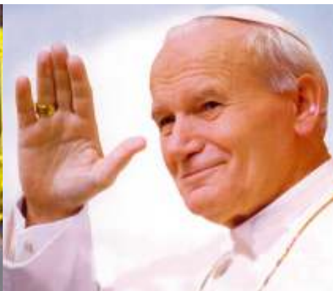
Paus Yohanes P. II Gambar 2.17