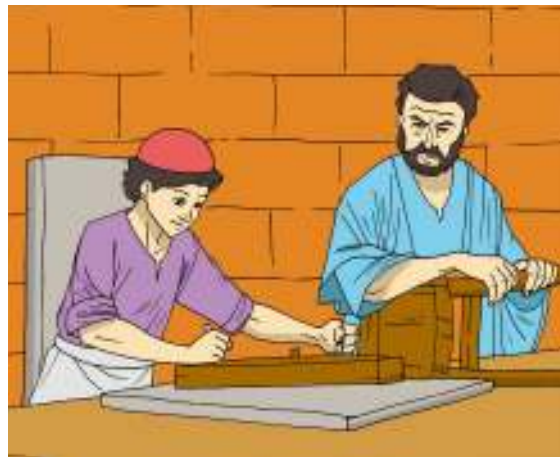
Gambar 1.7