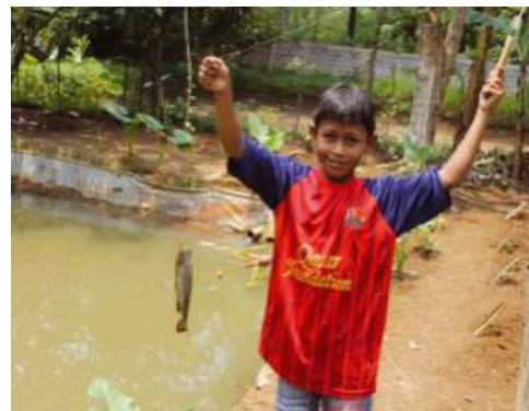
Gambar 1.2