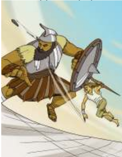
Gambar 2.8

Maka Saul mengenakan pakaian besinya sendiri kepada Daud dan ditaruhnyalah topi tembaga di atas kepala Daud dan disandangkannya pedangnya. Tetapi Daud tidak dapat berjalan dengan pakaian itu, karena tidak biasa baginya. Sebab itu ditinggalkannya pakaian besi itu, lalu diambilnya tongkatnya,