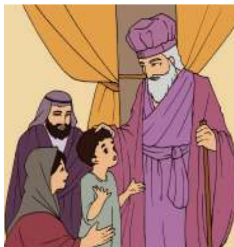
Gambar 2.4

Pada waktu itu, seorang dari suku Lewi, yang bernama Elkana, hidup di kota Ramata. Istrinya bernama Hana, ia tidak mempunyai anak. Tiap-tiap tahun kedua orang itu berziarah ke kota Silo untuk bersembah sujud dan untuk mempersembahkan korban. Pada suatu hari, Hana berdoa dengan mencururkan air matanya dan ia berjanji kepada Tuhan: "Tuhan semesta alam, jikalau Engkau mengaruniakan hamba-Mu seorang putra, niscaya saya akan mempersembahkan dia kepada-Mu