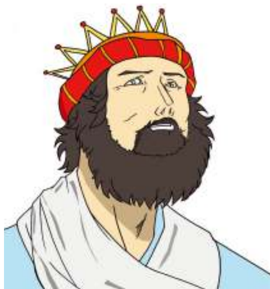
Gambar 2.9

Setelah Daud Mengalahkan orang Filistin, maka Saul dan Daud beserta semua tentara pulang. Wanita-wanita dari kota yang dilalui menyambut mereka sambil bernyanyi, “Saul mengalahkan seribu orang musuh, Daud menghancurkan selaksa orang.” Oleh karena itu, Saul amat marah dan sejak itu Daud tidak lagi