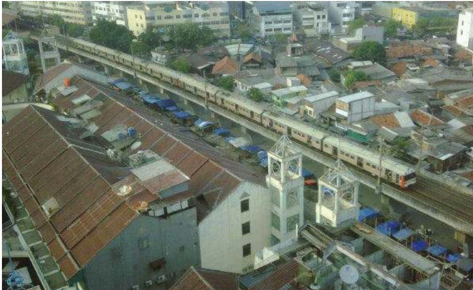
Gambar 1.6