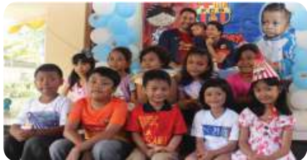
Sumber: Dok. Kemdikbud Gambar. 1.3 Anak laki-laki dan perempuan