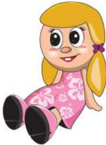
Sumber : Dok. Kemdikbud Gambar. 1.1 Boneka Cantik

Edo pun berhenti menimang boneka itu, kemudian menempatkan boneka milik Elda pada tempatnya.*** (sumber: Marianus Didi Kasmudi, SFK)