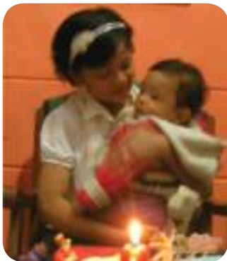
Gambar. 1.2 Anak yang masih kecil dan anak yang lebih besar

Guru mengajak anak-anak untuk mengamati gambar anak laki-laki dan perempuan: