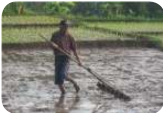
Gambar : 1.4 Bapak bekerja di sawah

Guru mengajak siswa untuk memperhatikan gambar atau foto yang menunjukkan kebiasaan yang dilakukan oleh perempuan dan laki-laki di dalam kehidupan sehari-hari. Misalnya gambar seorang ibu yang sedang menggendong bayi sambil menyuapi, memasak, mencuci, dan kebiasaan lainnya. Di sisi lain, guru juga dapat menunjukkan gambar seorang bapak yang bekerja di sawah, menjadi sopir, nelayan, dan pekerjaan lainnya.