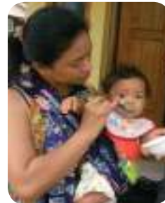
Gambar : 1.6 Ibu menyuapi anaknya

Dari pengamatan tersebut, guru mengajak siswa untuk menyampaikan pendapat, kesan, tanggapan, atau pertanyaan mengenai gambar atau foto yang mereka lihat.