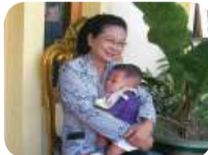
Gambar : 1.5 Ibu menggendong bayi