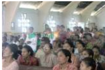
Gambar 1.2