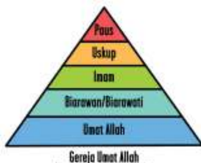
Gambar 1.3