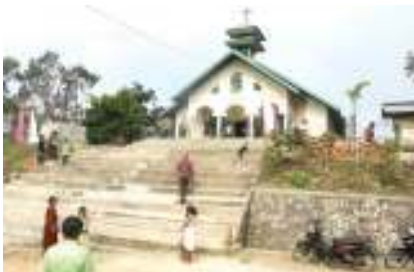
Sumber : (Dokumen penulis) Gambar 1.1