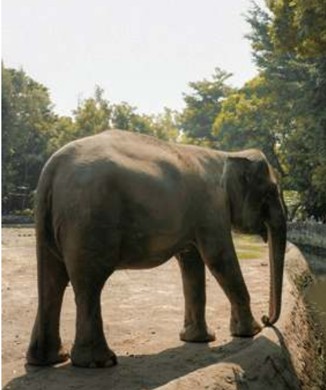
Gambar 12.1 Gajah

Dengan letak geografisnya yang unik, Indonesia menjadi negara dengan banyak keistimewaan dari sudut flora dan fauna. Untuk flora, ada tumbuhan kopi, cokelat, sampai pada aneka jenis pisang, mangga, juga anggrek yang hanya ditemukan di wilayah Indonesia. Untuk fauna, ada sejumlah satwa yang juga hanya dapat ditemukan di wilayah Indonesia, mulai dari komodo yang tergolong berukuran besar, buaya, sampai pada jenis serangga yang eksotis. Perhatikan beberapa gambar di bawah ini yang menunjukkan rupa dari para satwa itu.