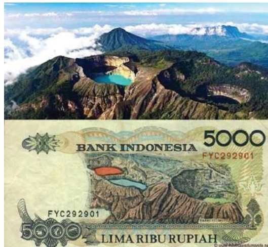
Gambar 11.3 Danau Kelimutu & pecahan uang Rp 5.000,00

Ternyata warna air pada kawah berubah tanpa pola yang jelas, tetapi dapat dijadikan indikator dari aktivitas magma Gunung Kelimutu. Ketika warna hijau berubah menjadi putih, artinya terjadi peningkatan aktivitas magma. Para ilmuwan dari Wesleyan University, Connecticut, melakukan survei geokimia pada danau. Mereka menemukan bahwa air di setiap danau berbeda secara kimia sehingga menghasilkan warna yang bervariasi. Sungguh ajaib karya Tuhan, ya? Keindahan danau ini sudah beberapa kali diabadikan di dalam lembaran uang Rp 1.000,00 dan Rp 5.000,00 yang dikeluarkan oleh Bank Indonesia.