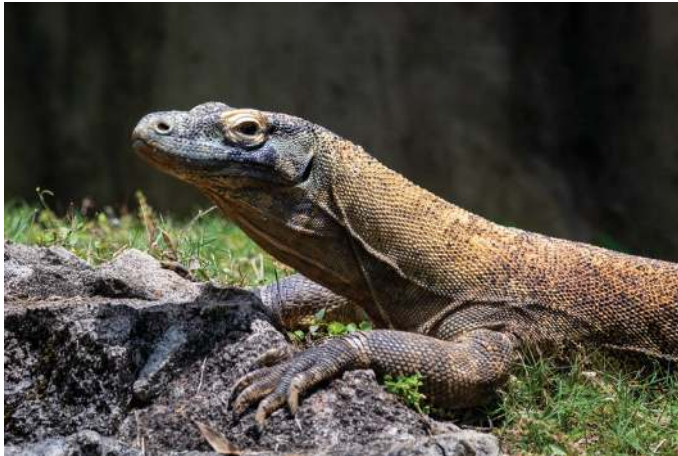
Gambar 11.1 Komodo

Foto di atas menunjukkan keindahan yang ditemukan di daerah Nusa Tenggara Timur. Gambar tersebut menunjukkan komodo sebagai satwa langka yang hanya ada di Indonesia, yaitu di Pulau Komodo, Pulau Rinca, dan Pulau Gili Motang. Ketiga pulau tersebut dijadikan Kawasan Taman Nasional Komodo karena merupakan habitat asli satwa komodo. Komodo adalah satwa liar yang hidup di alam terbuka. Komodo termasuk salah satu binatang purba yang masih bertahan sejak ratusan juta tahun yang lalu. Tidak banyak jumlah binatang purba yang masih dapat ditemukan pada masa kini, yaitu di abad ke-21. Komodo acapkali digambarkan sebagai kerabat dari dinosaurus atau binatang raksasa lainnya.