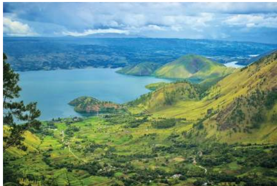
Gambar 12.3 Danau Sentani