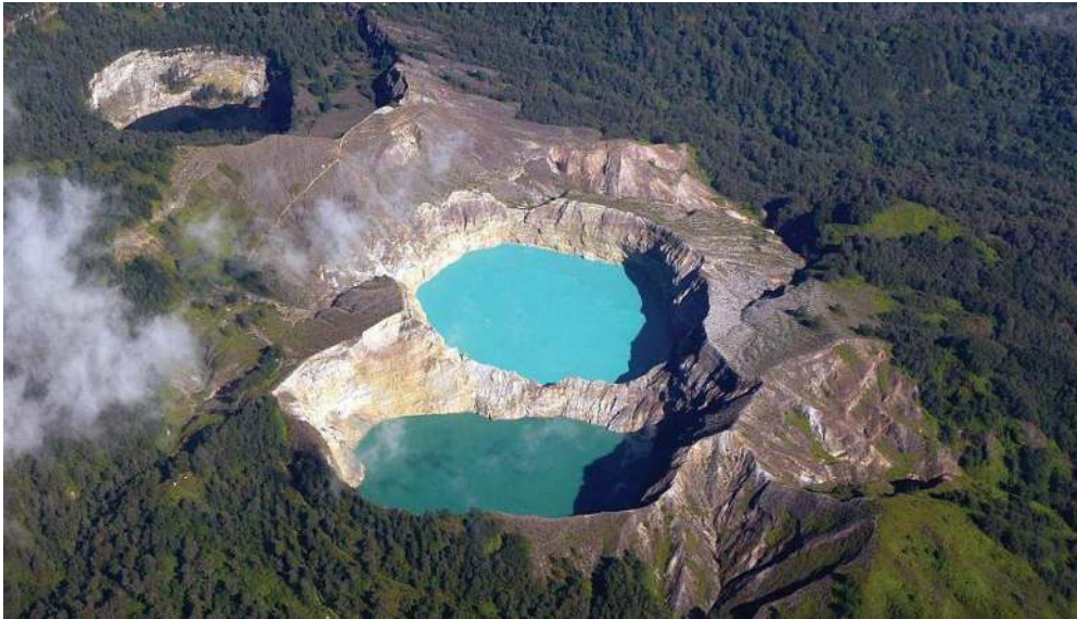
Gambar 11.2 Danau Kelimutu

Foto kedua menunjukkan keindahan Danau Kelimutu yang juga disebut sebagai Telaga Tiga Warna. Mengapa dinamakan demikian? Ada legenda yang menjelaskan perubahan warna air di danau ini, yaitu dari warna biru, berubah menjadi merah, lalu berubah lagi menjadi putih, dan perubahan ini terjadi dalam waktu yang relatif cepat. Namun, penjelasan ilmiah menyatakan bahwa keberadaan mikroorganisme di dalam danau dan perubahan suhu menyebabkan terjadinya perubahan warna air danau yang justru lebih jelas terlihat ketika kita menatapnya dari lokasi yang jauh lebih tinggi dari permukaan danau (kelimutu.id, 2020).