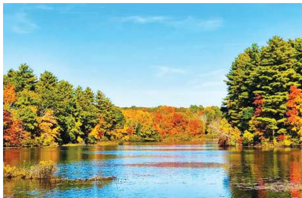
Gambar 12.4 Danau Sentani