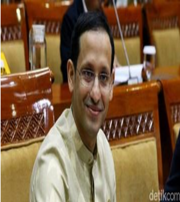
Name : Nadiem Anwar Makarim

In your group discussion, observe these pictures and classify their physical appearances with the words given below. You may add other words, if any. ( Di dalam kelompok diskusi kalian, amati kedua gambar dan kelompokkan ciri-ciri fisik mereka. Tambahkan kata-kata lainnya, jika ada. )