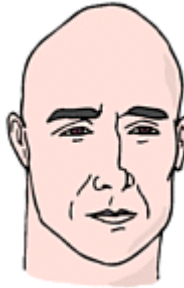
He is white. He has fair skin.