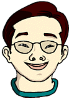
He is asian. He has light-brown skin.