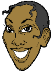
She is black. She has dark skin.