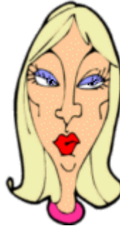
She is white. She has lightly tanned skin.