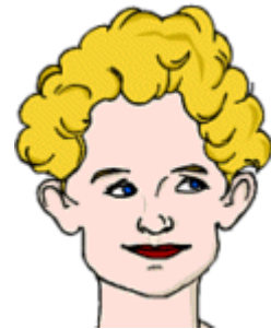
She is white. She has very pale skin.