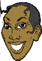
She has short hair.