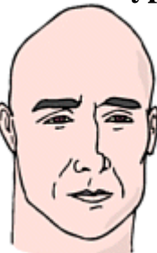
He has no hair. = He is bald.