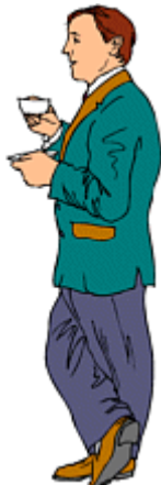
He is short. He is quite short.