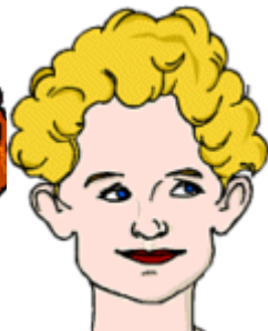
She has short hair.