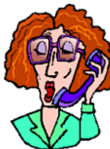
She has medium length hair.