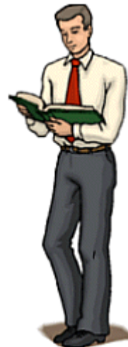
He is normal height. He is relatively normal height.