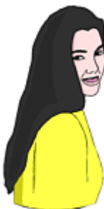
She has long hair.