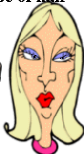
She has medium length hair.