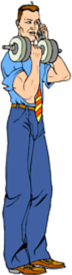
He is tall. He is very tall.