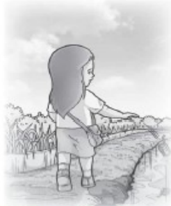
Ninit membuang sampah di sungai