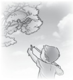
Dudu berburu burung