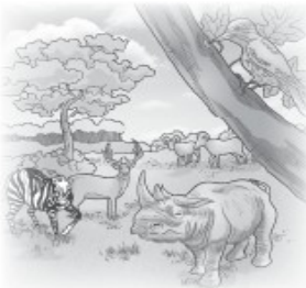
Binatang hidup bebas