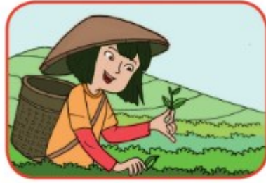
Memetik daun teh