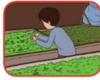
Mengolah daun teh