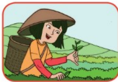
Memetik daun teh