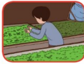
Mengolah daun teh