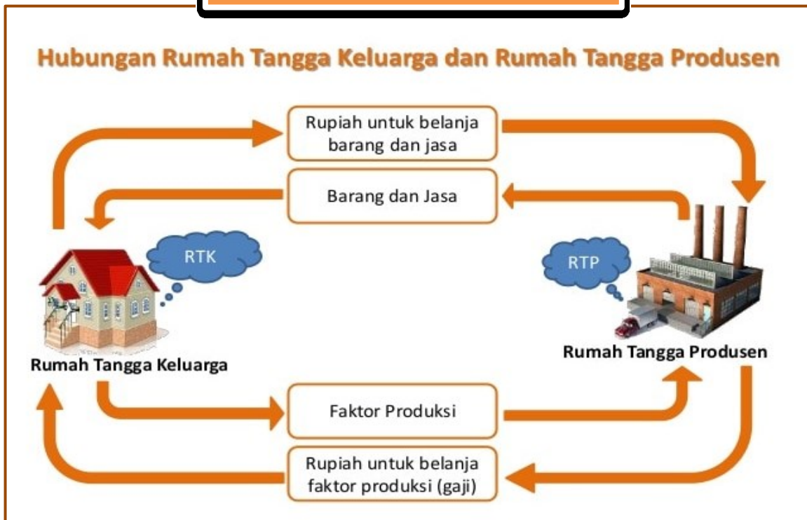
Diagram Perekonomian 2 Sektor (Perekonomian Sederhana)