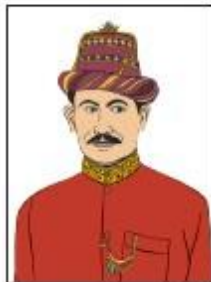
Sultan Iskandar Muda