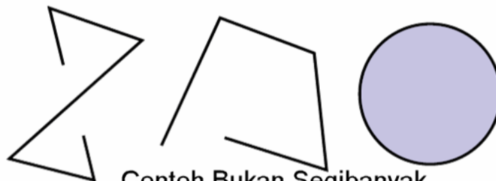
Contoh Bukan Segibanyak