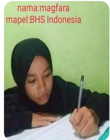
nama:magfara mapel:BHS Indonesia