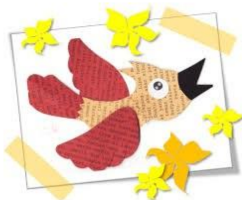
4 - C