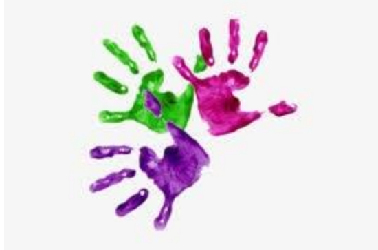
2 - A