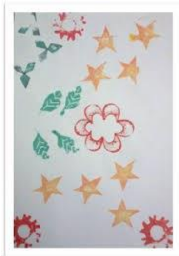
3 - B