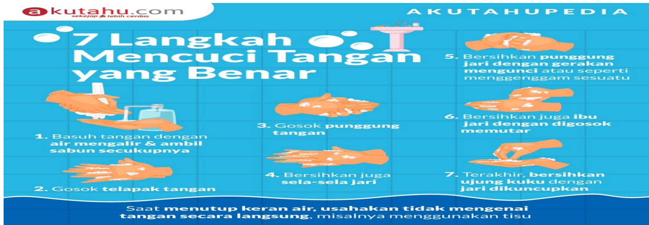
7 Langkah Mencuci Tangan Dengan Benar