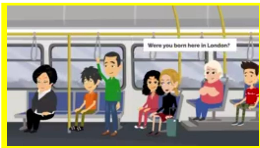
Source https://www.youtube.com/watch?v=liAsT4DqalQ (minute 3:52 – 5:00)

Practice the dialogue below and analyze how they introduce each other.