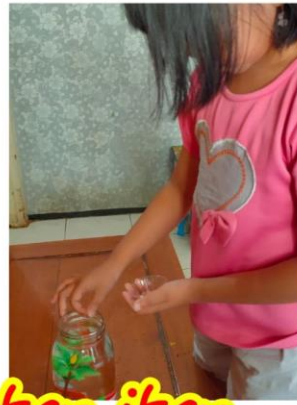
Memberi makan ikan