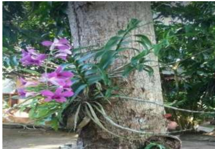
Gambar 4 Tumbuhan epifit

tubuhnya pada ikan hiu . Ikan hiu sekalipun diikuti oleh remora tidak untung dan tidak dirugikan oleh ikan remora, sedangkan ikan remora mendapat keuntungan dari ikan hiu yang berupa energi untuk berpindah tempat, dan memperoleh makanan dari sisa makanan dari ikan hiu. Bunga anggrek dengan pohon yang ditumpanginya. Bunga anggrek merupakan tanaman epifit, yaitu tumbuhan hijau yang tumbuh menempel pada batang tumbuhan yang tinggi. Tujuannya adalah untuk mendapatkan cahaya matahari guna proses fotosintesis. Jadi, epifit tidak mengambil makanan dari tumbuhan yang ditumpanginya.