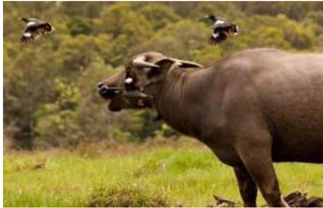
Gambar.4. Interaksi Burung jalak dengan kutu kerbau