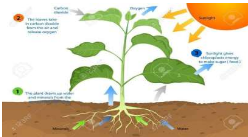
Gambar 1. Proses Fotosintesis

Keseimbangan suatu ekosistem akan terjadi, bila komponen-komponennya dalam jumlah yang berimbang. Komponen-komponen ekosistem mencakup : Faktor Abiotik, Produsen, Konsumen dan Dekomposer (Pengurai). Di antara komponen-komponen ekosistem terjadi interaksi, saling membutuhkan dan saling memberikan apa yang menjadi sumber penghidupannya. Tuhan menciptakan faktor abiotik untuk mendukung kehidupan tumbuh-tumbuhan sebagai produsen; kemudian tumbuh-tumbuhan tersebut menjadi mendukung kehidupan organisme lainnya (binatang dan manusia) sebagai konsumen maupun detritivora, dan akhirnya dekomposer (bakteri dan jamur) mengembalikan unsur-unsur pembentuk makhluk hidup kembali ke alam lagi menjadi faktor-faktor abiotik, demikian seterusnya terjadilah daur ulang materi dan aliran energi di alam secara seimbang.