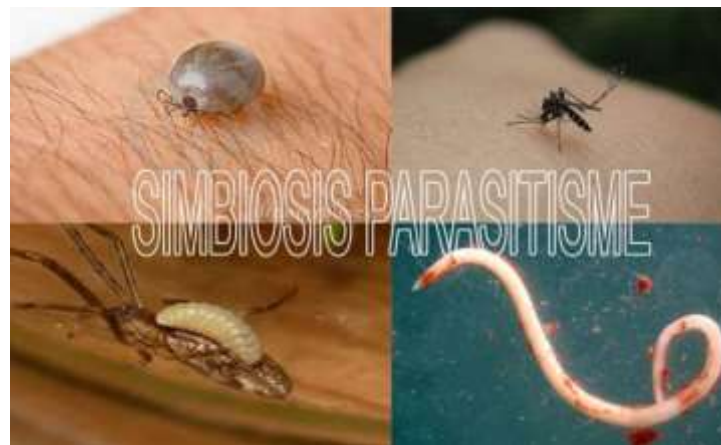
Gambar 5. Simbiosis Parasitisme

Benalu ( Loranthus sp.) dengan tanaman inang. Benalu tidak mempunyai akar yang semurna, sehingga tidak dapat menyerap air dan unsur hara dari tanah dengan baik, sehingga dia hidup menempel pada batang tanaman inang dan akarnya masuk ke pembuluh angkut tanaman untuk menyerap air dan unsur hara dari tanaman inang tersebut sehingga merugikan. Cacing perut ( Ascaris lumbricoides ) dengan usus manusia. Cacing mengambil dan menyerap sari makanan, manusia dirugikan sehingga manusia kurus kekurangan gizi. Kutu yang menghisap darah manusia. Kutu merupakan ektoparasit. Kutu biasanya menempel di kulit hewan mamalia dan manusia. Makanan kutu adalah darah inang. Kutu mengambil makanan dengan cara menggigit kulit inang lalu mengisap darahnya.