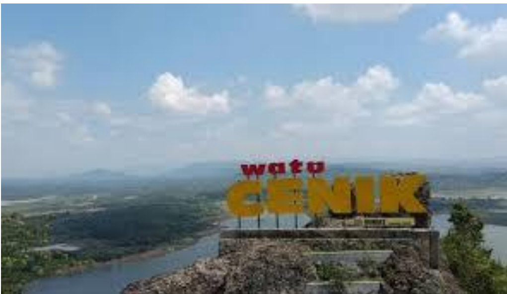
Watu Cenik Hill