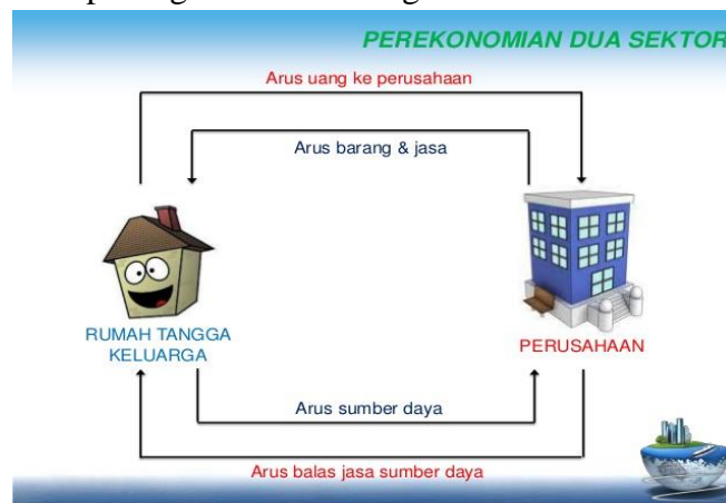
Gambar 3.2. Arus Lingkaran Kegiatan Ekonomi 2 Sektor

Hubungan antara rumah tangga produksi dan rumah tangga konsumsi dalam kegiatan ekonomi dapat digambarkan sebagai berikut.