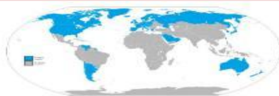
Negara Maju (Developed Country) & Negara Berkembang (Developing Country)

Peserta didik diberikan stimulus dengan menayangkan gambar persebaran negara maju dan berkembang di dunia.