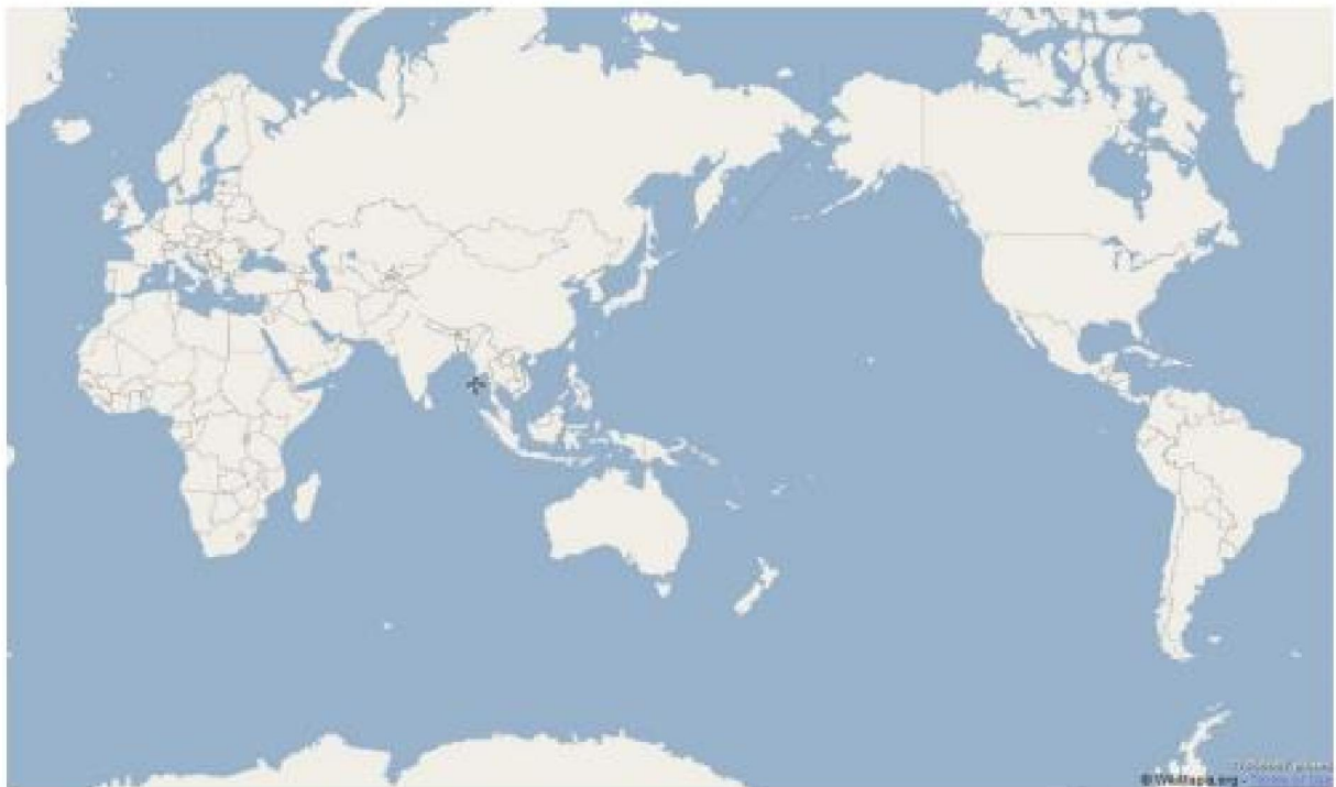
Peta Persebaran Negara Maju dan Negara Berkembang

Berdasarkan peta buta dibawah ini, warnailah dengan warna yang berbeda, agar tampak dengan jelas yang termasuk negara berkembang!