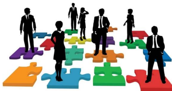
Gambar 3.8 Pengembangan SDM

Globalisasi merupakan tantangan besar bagi setiap negara. Tidak mungkin suatu negara menutup diri dari negara lain siring dengan ketergantungannya terhadap bangsa lain. Oleh karena itu setiap bangsa harus mempunyai kemampuan untuk menempatkan diri dalam eraglobalisasi ini namun juga harus dapat mempertahankan kehidupan kebangsaannya.