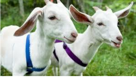
gambar untuk soal no 1-3

https://docs.google.com/forms/d/e/1FAIpQLSeIZ0oj3o7Ih_wEDXM3CDjebCXDOa6tT1YjUZhPWgtFP02Bog/viewform