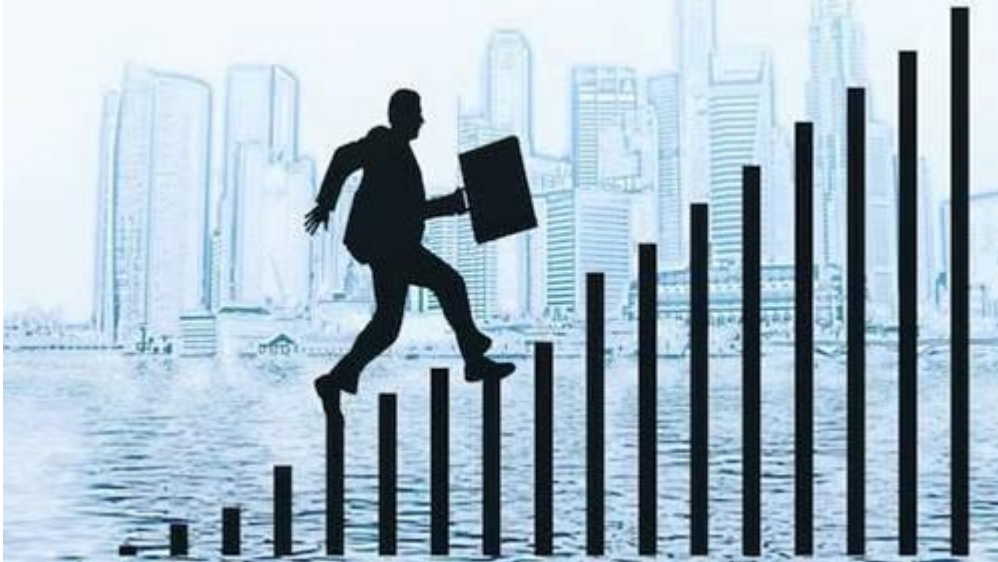
Gambar 1 : ilustrasi mobilitas sosial

https://www.seluncur.id/bentuk-bentuk-mobilitas-sosial/