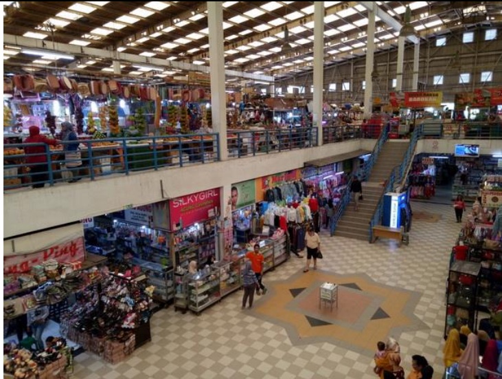
(foto pasar tradisional koja – bersebelahan dengan lokasi sekolah)

guru menanyakan apakah mereka mengenali gambar tersebut dan bagaimana pengalaman mereka tentang berbelanja, ada proses apa yang mereka alami?