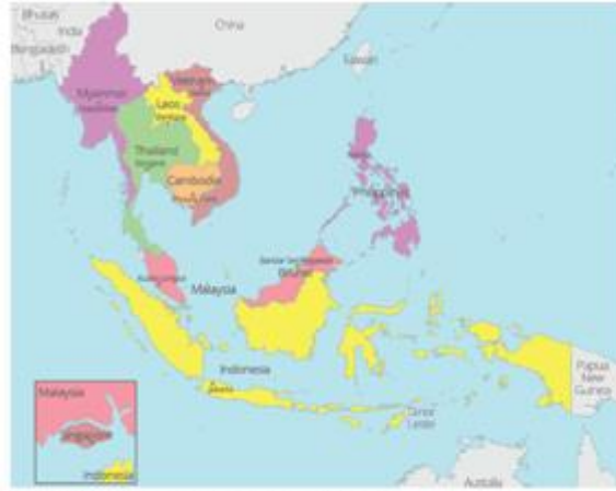
Gambar 1.1 Letak geografis negara-negara ASEAN.

Perhatikan Peta di atas dan lengkapi tabel di bawah ini !