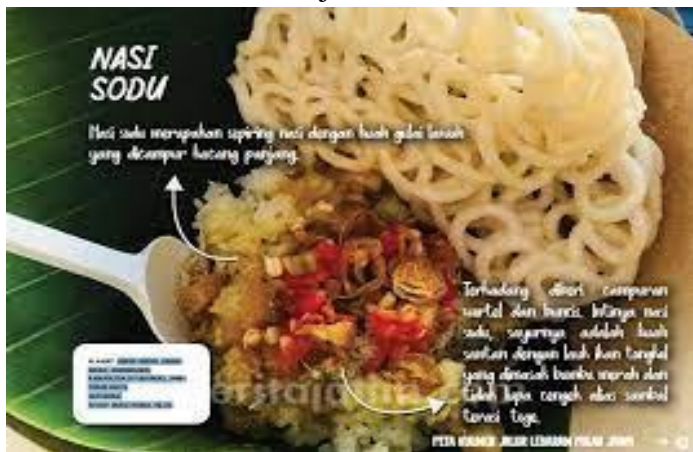
Gambar 1. Nasi Sodu Arjuna