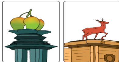
Foto di samping adalah patung di Indramayu. Buah mangga merupakan identitas kota tersebut. Begitu pula dengan patung Rusa. Banyak seniman menggunakan benda atau makhluk hidup di sekitar sebagai inspirasi mereka. Patung apa yang kamu buat? Pada pembelajaran dua kamu sudah menentukan model patungmu. Lanjutkan kreasi kamu sampai selesai. Saat mengerjakan patungmu, kamu harus sabar dan bekerja dengan tekun.

Guru mencatat proses kegiatan siswa dengan menggunakan catatan anekdot yang ada di halaman penilaian.