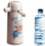
air hangat / air dingin