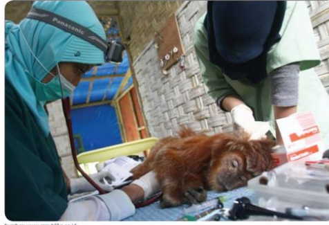
Dokter hewan memeriksa seekor hewan yang sakit.