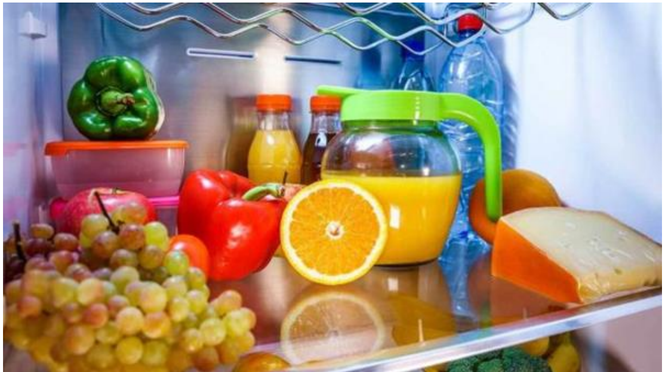
Video Materi / Bahan Ajar (Quantifying Determiner & Preposition)