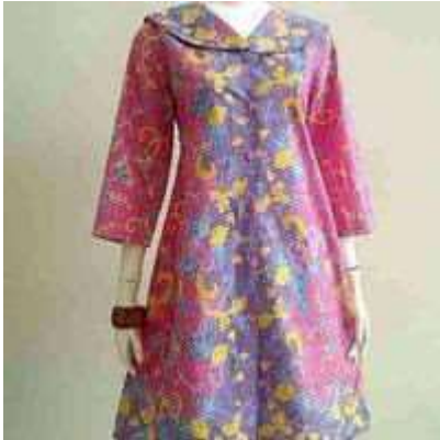
Gambar 1.1. Desain Tunik