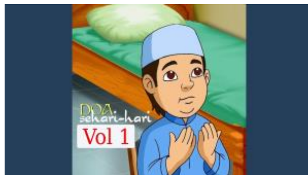
1 - Doa Sebelum Belajar