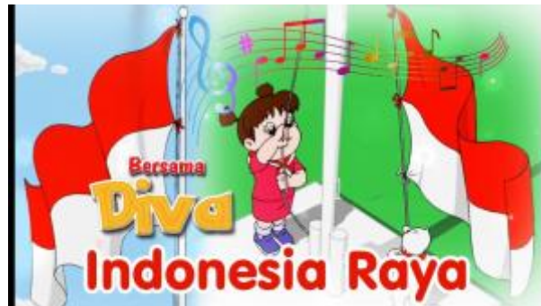
3 - Menyanyikan Lagu Indonesia Raya