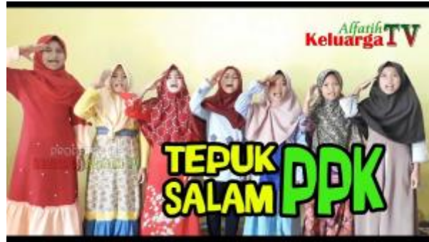
2 - Belajar bersama tepuk dan salam PPK