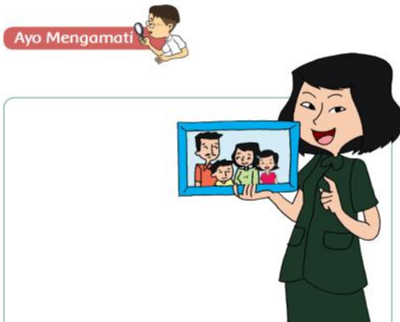
7 - Anak-anak kita cermati gambar di atas ya...

Lihatlah foto keluarga Udin pada gambar.