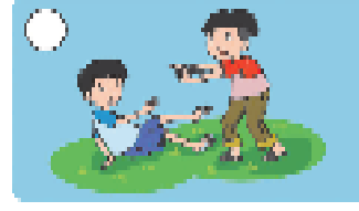
berlakuk kasar kepada teman ( )