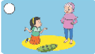
marah kerana kalah ( )