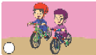
menggunakan perlengkapan untuk keselamatan ( )

Perhatikan Lani dan teman-teman dibawah ini!