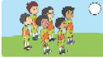
berbincang-rapil sebelum bermain ( )