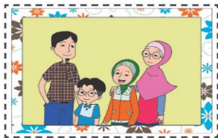
Foto anggota keluarga