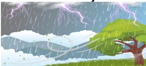
Hujan Gerimis Dan Petir