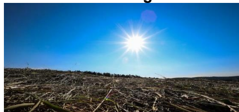
Matahari Terik Sekali