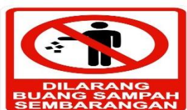
Dilarang Membuang Sampah Sembarangan