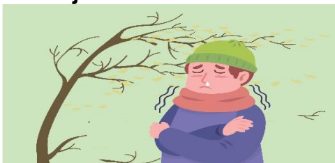
Udara Yang Dingin