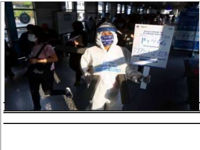
Wearing a hazmat suit, a member of a Transjakarta community holds up a sign with updated data on the number of COVID-19 cases in Jakarta to raise awareness on health protocols within the Harmoni bus shelter in Jakarta on July 17.