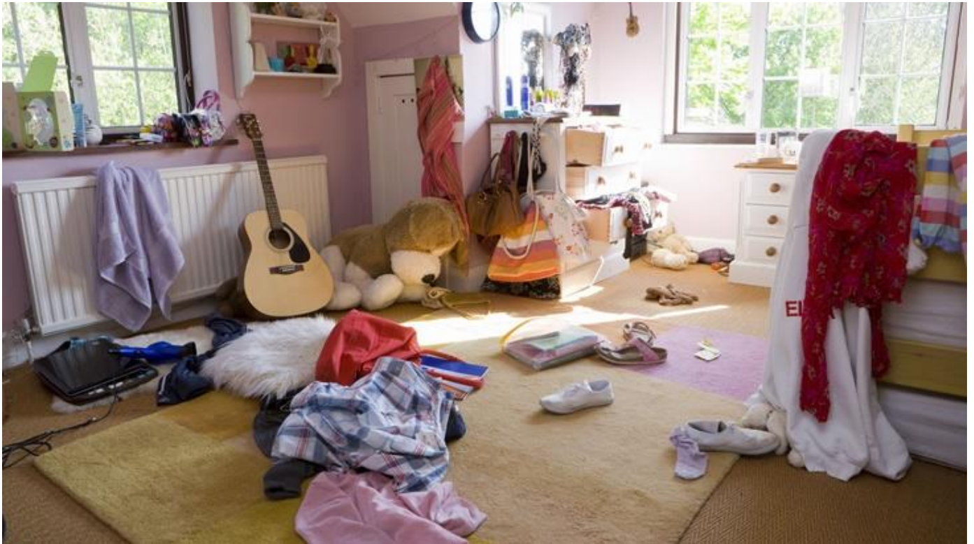
RUANGAN YANG KOTOR