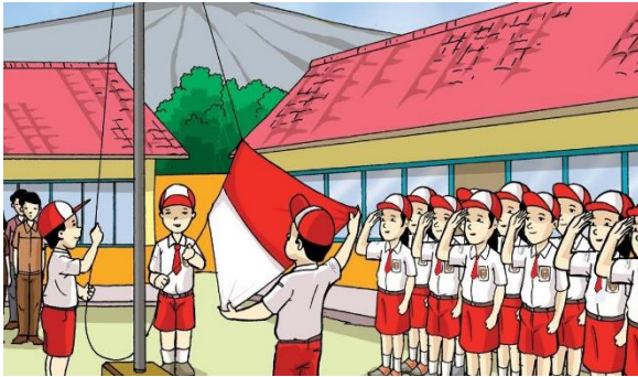
Gambar Kelompok 1