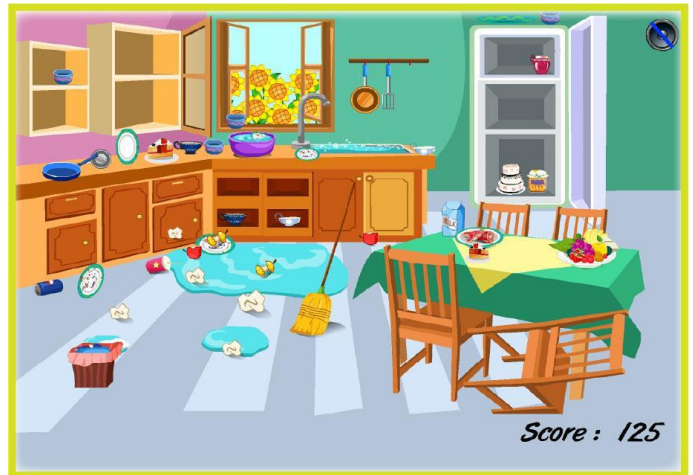
Score : 125