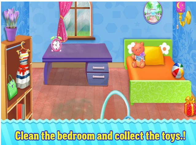
Clean the bedroom and collect the toys!