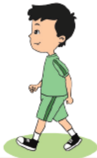
Berjalan ke depan