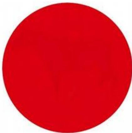
3. Gambar 3