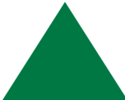
2. Gambar 2