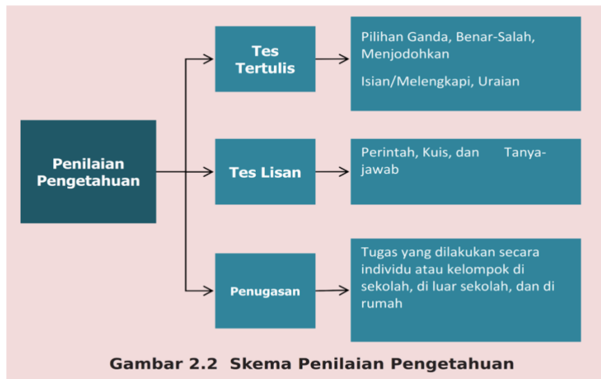
Gambar 2.2 Skema Penilaian Pengetahuan