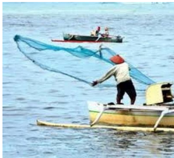
1.3 Nelayan tradisional