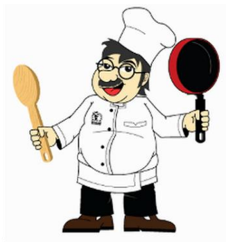
1.1 Juru masak atau koki