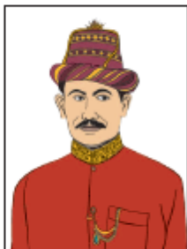
1607 – 1636 Masehi

Amati tokoh-tokoh tersebut. Apa yang kamu ketahui dan ingin kamu ketahui lebih lanjut tentang peninggalan pemerintahan raja-raja tersebut?