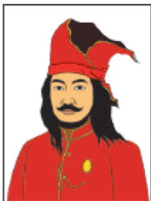
1654 – 1660 Masehi