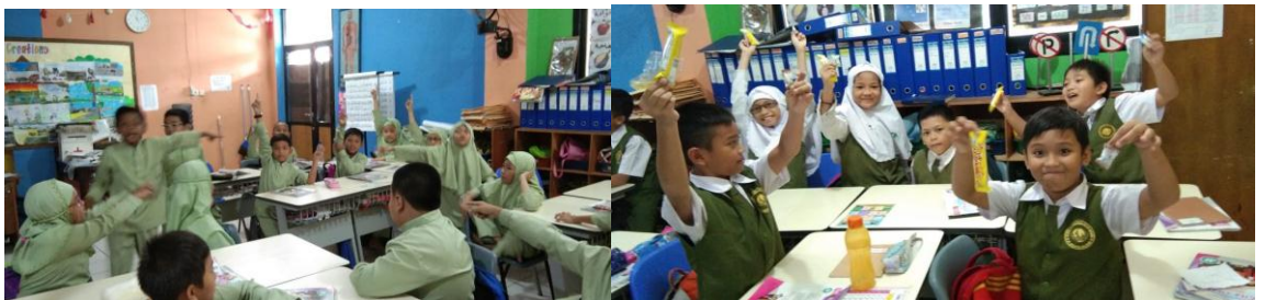
Antusias siswa mengikuti pertandingan