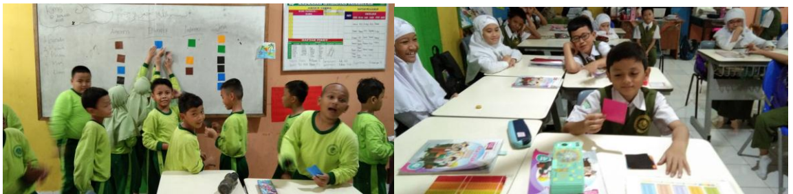
Permainan akademik yang melibatkan partisipasi seluruh siswa