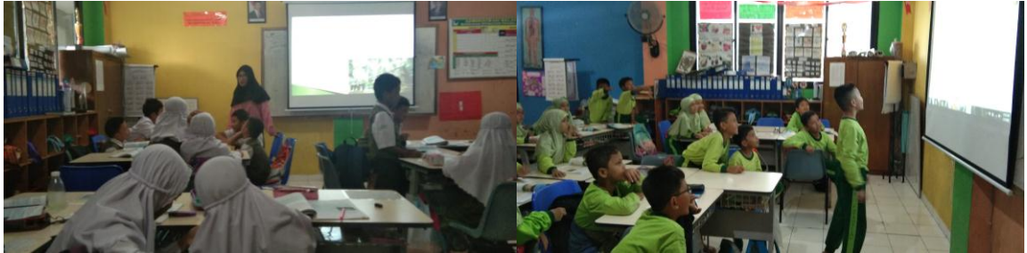
Guru membimbing jalannya pertandingan